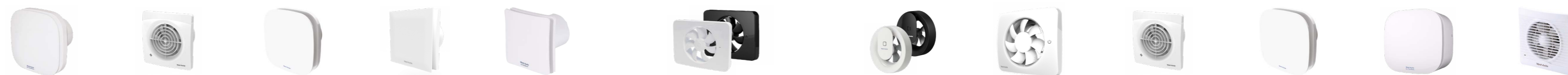
SERENE SUPRA SUPRA DESIGN MUTE SYLPH IQ SVARA SVENSA SUPRA SUPRA DESIGN SCOPE AZUR